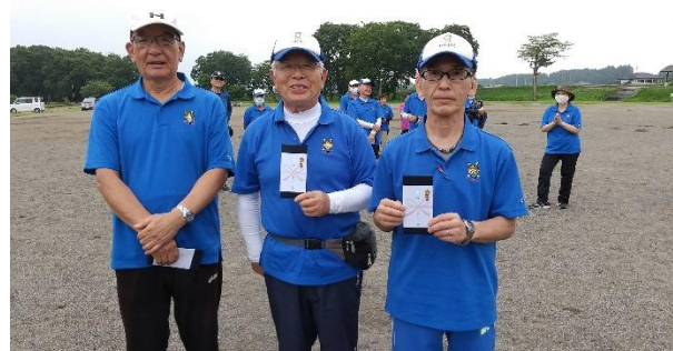
第3位 足利 Eチーム