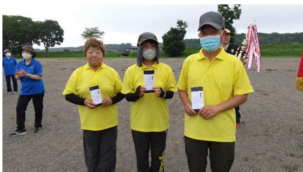
第3位 陽東ビートル Bチーム